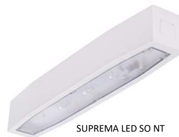
SUPREMA LED SO NT