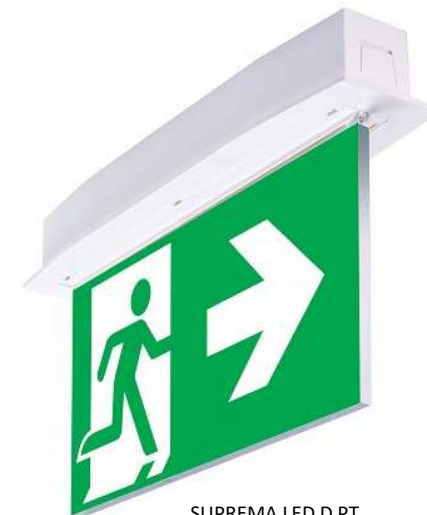
SUPREMA LED D PT