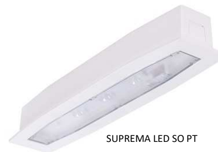
SUPREMA LED SO PT